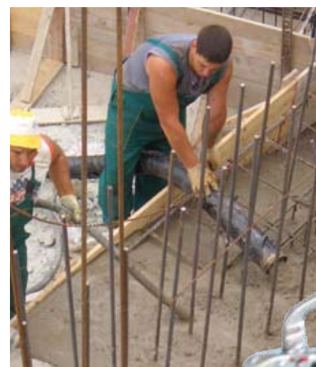
o para bombear hormigón fino de hasta 16 mm. El anillo automático autosellador permite utilizarla incluso para solado fluido (figura derecha).