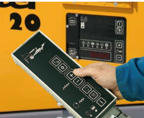
Vous commandez la SP 20 DHF directement à partir d'un seul côté – ou confortablement via une radiocommande.