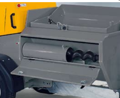
Pratique: ici, vous pouvez ranger un outil ou une vis de rechange.

Avec une machine vraiment puissante, telle que la SP 20 DHF même des surfaces importantes en un temps record ne sont pas un problème. Lors de la mise en œuvre de chape autonivellante directement de la bétonnière portée elle excelle. Que ce soit une chape fluide à base d'anhydrite, d'anhydrite-ciment ou de ciment, ... le nombre de matériaux qu'elle pompe est énorme.