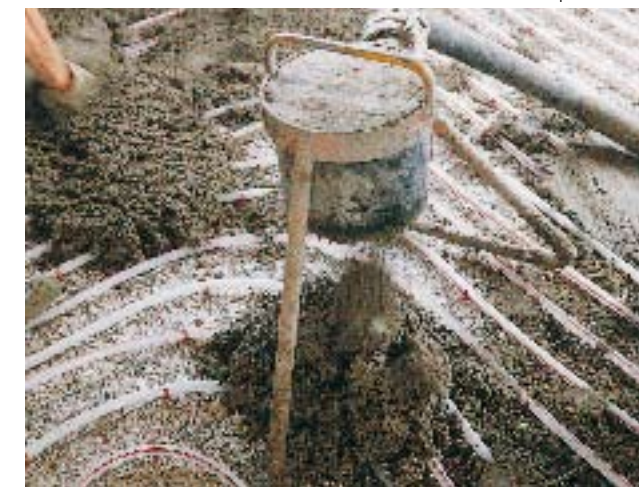
...Písek a drobný štěrk do velikosti zrna 16 mm (např. při keramzitovém izolačním zásypu).