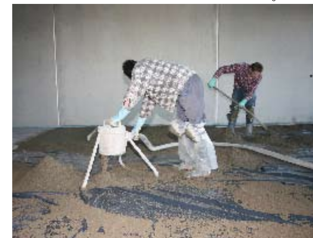
Dopravníky Mixokret dopravují nejrůznější materiály. Mazaninu do velikosti zrna 8 mm, ...

Můžete je však také nechat úplně pohodlně zvednout jeřábem téměř kamkoliv. Umožňují to nová jeřábová závěsná oka, která se stala pevnou součástí stroje. Znamená to úsporu místa a drží naprosto pevně.