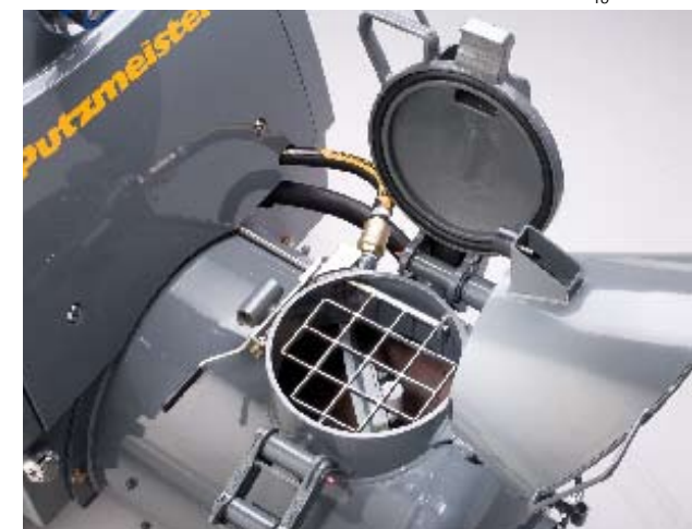
Polohu víka na novém míchačím bubnu můžete od nynějška stanovit zcela libovolně.