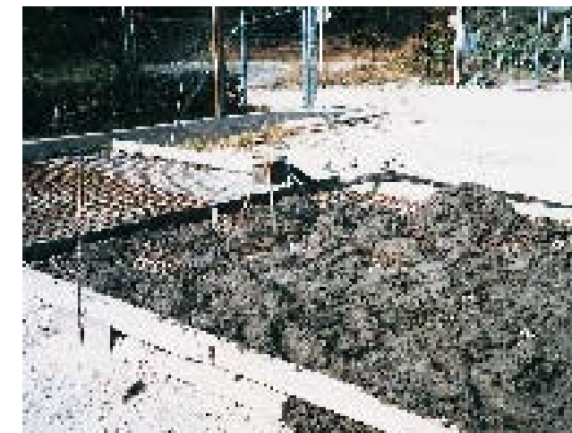
Dokonce i beton čerpají bez problémů i na velké vzdálenosti.