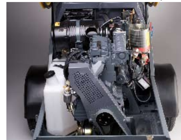
Vyklopíte-li ochrannou mřížku nahoru, míchač dopravníku M 740 se okamžitě vypne. Míchání opět začne, teprve až se mřížka zase uzavře.