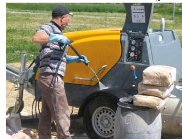
Mixokret může být také vybaven výkonným vysokotlakým čističem.