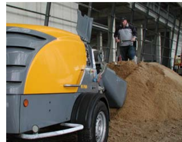
Новый Миксокрет - вариант со скипом и скраппером.