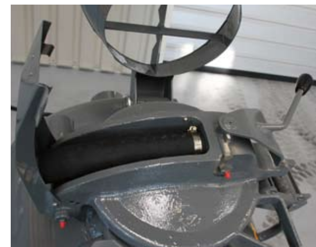
Большая загрузочная горловина смесительного бункера, простота и надежность в работе.