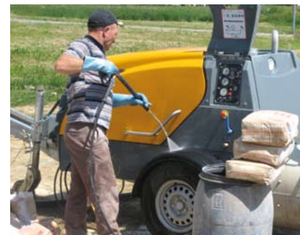
Опционально Миксокрет может быть оборудован мощным очистителем высокого давления.