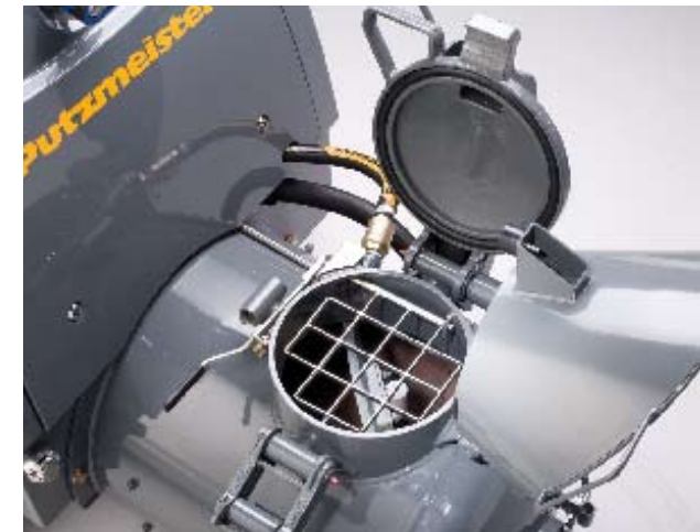
Podlašavanje položaja poklopca na novoj komori za mešanje u potpunosti zavisi od vas.