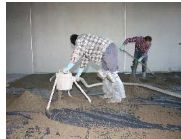
Mixokret transportuje različite materijale. Estriht do 8 mm granulacije, ...

Sve što trebate da bi rukovali novim Mixokretom vam je pregledno i na dohvat ruke. Prekidači za rukovanje su na uobičajenom mestu ispod robustnog poklopca. Novo dizajnirani poklopac dobro dihtuje i nudi bolju zaštitu od prljavštine i oštećenja.