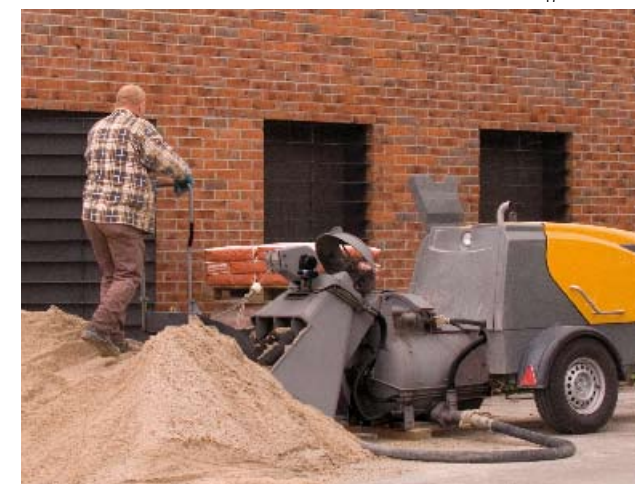
Novi Mixokret u kompletu sa utovarnom korpom i skreperom.