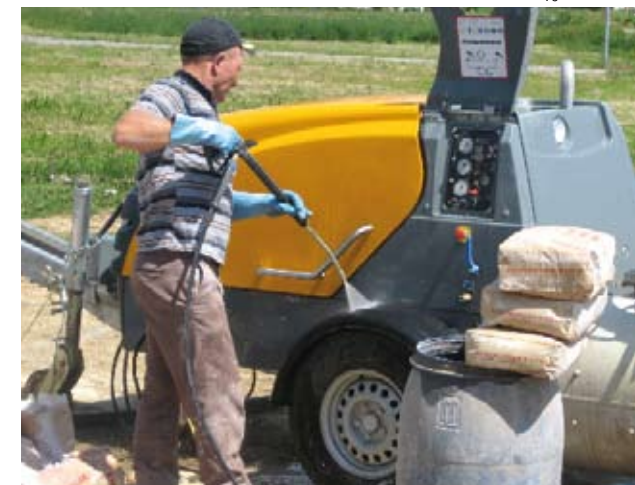
Zahvaljujući praktičnom centralnom podmazivanju kožete zaboraviti "zaribavanje" ležaja na mešalici.