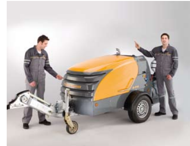
Inteligentno rešenje protoka vazduha štiti čoveka i motor. Vazduh se usisava sa prednje strane a izduv je na zadnjoj strani, iznad mašine.