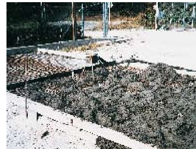
Beton pumpa - bez problema takođe na velike udaljenosti.